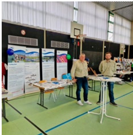
Unser Stand bei „Vereine stellen sich vor“ in Mertigen

Sollten bei Euch im heimatlichen Umkreis Events stattfinden, die Ihr für einen Öffentlichkeitsauftritt der Bezirksjugendleitung geeignet haltet, meldet Euch bei uns!