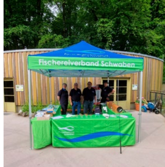
Unser Infostand im Zoo Augsburg

Sollten bei Euch im heimatlichen Umkreis Events stattfinden, die Ihr für einen Öffentlichkeitsauftritt der Bezirksjugendleitung geeignet haltet, meldet Euch bei uns!