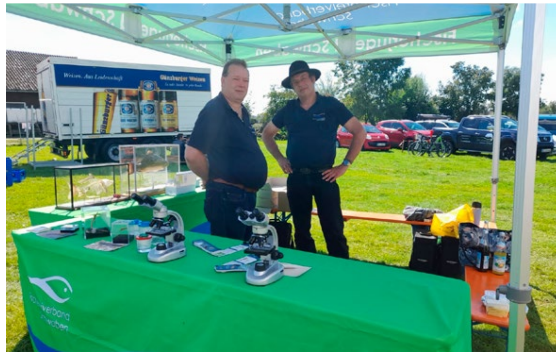
Unser Infoteam beim Karpfenfest der Fischzucht Vollmann-Schipper