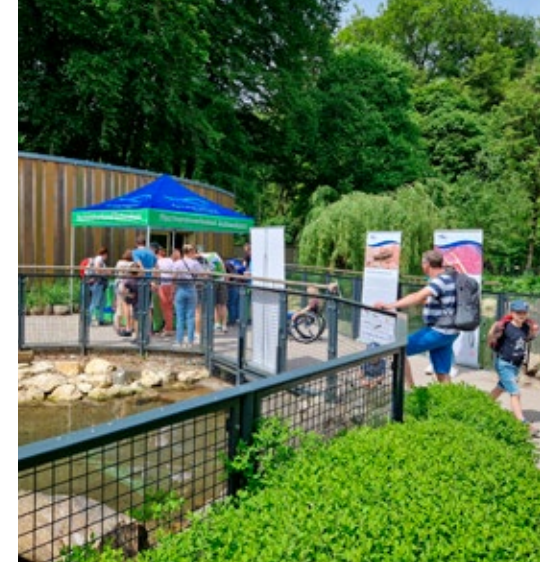
Das Interesse der Zoobesucher war groß