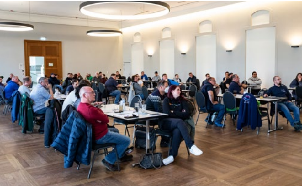
Der volle Saal zeigt das Interesse an der Arbeit der Bezirksjugendleitung.

Am 19. März 2022 hat unser Bezirksjugendausschuss endlich wieder in Präsenz stattgefunden. Im Gasthof „Alte Brauerei“ trafen sich insgesamt 46 Jugendleiter und Betreuer aus 25 Vereinen, um von der Bezirksjugendleitung über das letzte Jahr und das kommende Jahr informiert zu werden. Dabei wurden auch drei langjährige Jugendleiter aus Schwaben mit dem Silbernen Ehrenzeichen des Fischereiverbandes Schwaben geehrt.